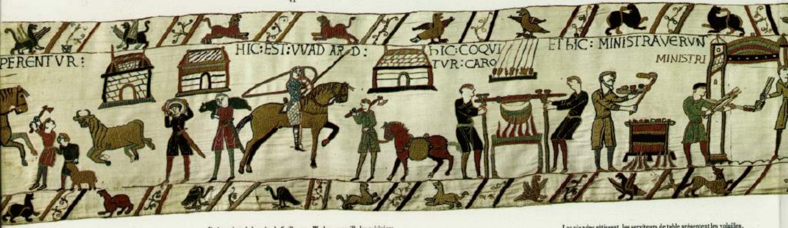
Les viandes rôtissent, les serviteurs de table présentent les volailles.