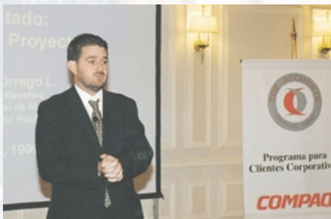
Claudio Orrego hablando de la modernización del Estado.

Radisson. Durante su exposición, Orrego destacó el objetivo del Poder Ejecutivo de “incorporar el uso de las tecnologías de información y comunicaciones en la Administración Pública, como una herramienta estratégica para mejorar la eficiencia en la gestión, la colaboración interinstitucional y la transparencia y rendición de cuentas del Estado para con los ciudadanos”.