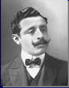
Pedro Paulet 1874 - 1945