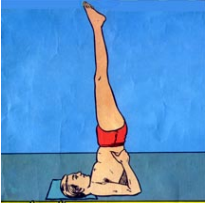
ऊर्ध्वसर्वांगासन URDHAW SARVANGASAN