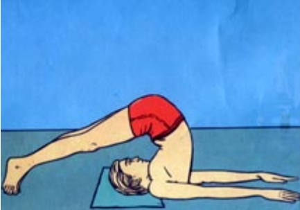
सर्वांगासन SARVANGASAN (हलासन) (HALASAN)