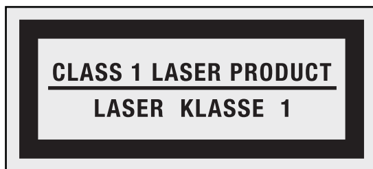
Пример за етикет

CLASS 1 LASER PRODUCT LASER KLASSE 1 LUOKAN 1 LASERLAITE APPAREIL A LASER DE CLASSE 1 KLASS 1 LASER APPARAT