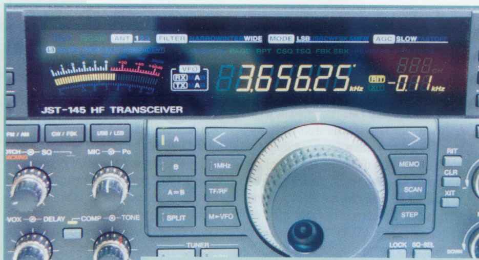
L'afficheur LCD couleur est un modèle du genre.

Commençons par évaluer les qualités du récepteur, et comme il y a des contests tous les week-ends, profitons-en ! On appréciera rapidement les charmes d'une commande, le BWC qui règle la largeur de la bande passante du récepteur. Croyez-moi sur parole, c'est efficace ! Le PBS (décalage de la bande passante FI) permet également de lutter contre les voisins trop envahissants. Sur les bandes basses, on se passera volontiers du préamplificateur. Sa sélection est mémorisée en fonction de la bande de trafic. Un commutateur à 4 positions commande l'atténuateur d'entrée (0, 3, 6 et 12 dB). De plus, les circuits d'entrée HF sont accordés électroniquement (pas de filtres "de bande"), en fonction de la fréquence affichée. Les résultats annoncés par le constructeur sont éloquentes : dynamique 106 dB et point d'interception à +20 dBm. Le seuil du bruit de fond est à -139 dBm.