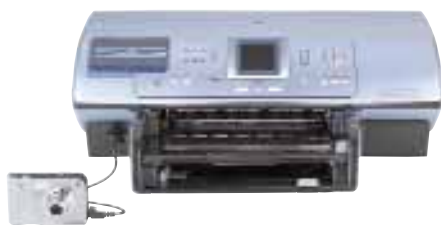
Impresora Fotográfica HP Photosmart 8450 con Cámara Digital HP Photosmart R707