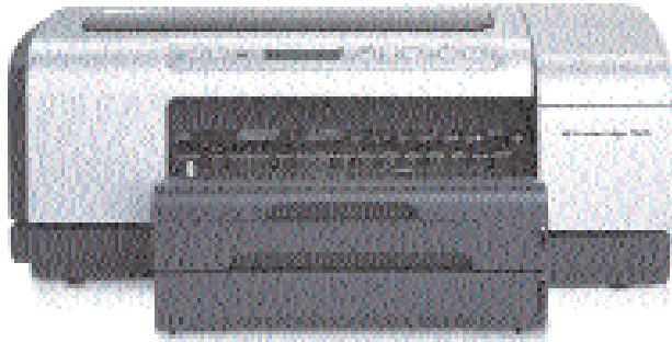
HP Business Inkjet 2800