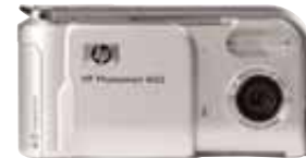
HP Photosmart M22

Cámara de alta resolución y excelente calidad a un precio accesible. Cuerpo metálico. Resistente al agua y a cualquier clima. Diseño moderno y ultra-compacto. Panorámicas. Zoom digital 6X. pantalla LCD de 3,8 cm. 16 MB de memoria interna. Ranura para tarjetas de memoria SD (secure digital). 3 años (U4796E).