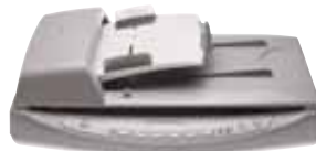
HP Scanjet 8250

Ideal para empresas que manejan grandes cantidades de digitalización de imágenes y documentos.