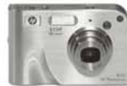
HP Photosmart R717

Alta resolución y el sistema HP Real Technologies, con un diseño ergonómico y elegante. 6.2 MP de resolución. Fotos panorámicas y eliminador de ojos rojos. Batería de Litio recargable y cargador incluidos en la caja. Cuerpo de acero inoxidable con diseño ultra compacto. Pantalla LCD de 4,6 cm. Zoom óptico 3X, zoom total 24X. 32 MB de memoria interna y ranura para tarjetas de memoria SD (secure digital).