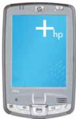
HP iPAQ serie hx2000

Lo último en movilidad con alto desempeño, seguridad, conectividad y capacidad de expansión.