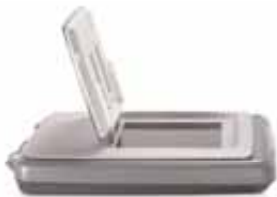
HP Scanjet 4070

Obtenga digitalizaciones con calidad profesional en sólo segundos.