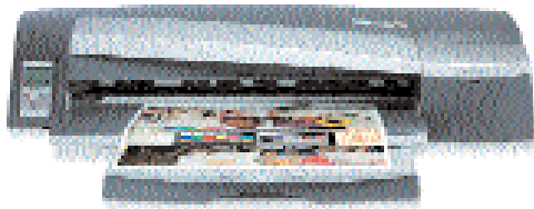
HP DesignJet 130/130nr

Imprime de todo, desde documentos de negocios hasta impresiones de gran tamaño: folletos, manuales, dibujos técnicos, afiches, pancartas y más, con resultados de calidad profesional. Estos son algunos ejemplos de las profesiones que se benefician con nuestras diferentes soluciones: