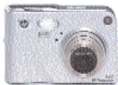
HP Photosmart R607

Facilidad de operación con resultados de alta calidad. 4.1 MP de resolución. 8 modos de captura de fotos. Diseño ergonómico exclusivo de HP para operarla con una sola mano. Conexión a PC, impresora y TV. Opción de Servicio en Banco 3 años (U4796E).