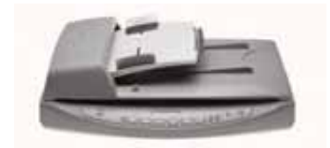
HP Scanjet 8290

Ideal para profesionales que trabajan en grupo y que requieren funciones avanzadas y descentralizadas de administración de documentos.