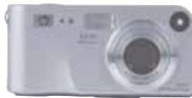
HP Photosmart M307

Accesorios. Una excelente forma de aprovechar su cámara es ampliando sus capacidades. HP le ofrece impresoras fotográficas, software de edición fotográfica, estuches y trípodes, entre otros, para que pueda satisfacer su necesidad de negocios.