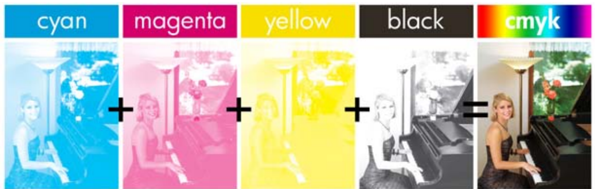
Figura 1. As imagens na HP Color LaserJet são criadas por meio da combinação de quatro cores: ciano, magenta, amarelo e preto.

O olho humano é sensível à precisão das cores, especialmente em relação a fatores como nuances, tons e o realismo de uma imagem. As partículas de toner colorido para impressão a laser precisam ser muito uniformes em seu tamanho e formato, bem como previsíveis em seu comportamento e controle da carga elétrica, a fim de assegurar que as cores impressas sejam precisas, reproduzíveis e realistas aos olhos.