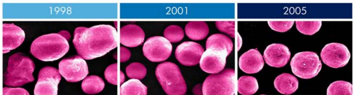
Figura 4. Aperfeiçoamentos feitos com o tempo tornaram o novo toner HP ColorSphere mais uniforme no tamanho das partículas, na distribuição do tamanho e no formato. O toner carrega e se funde mais rápido, mantendo sua carga por toda a vida útil do cartucho.

O controle preciso da carga das partículas de toner também depende em parte dos aditivos de superfície. Partículas com uma quantidade constante de aditivos em relação à sua massa total e um formato esférico uniforme possibilitarão um controle de carga muito maior e, portanto, gerarão impressão de qualidade superior.