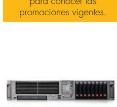
HP ProLiant DL380 G5

Con funciones líderes de administración y servicio para centros de cómputo corporativos y oficinas remotas