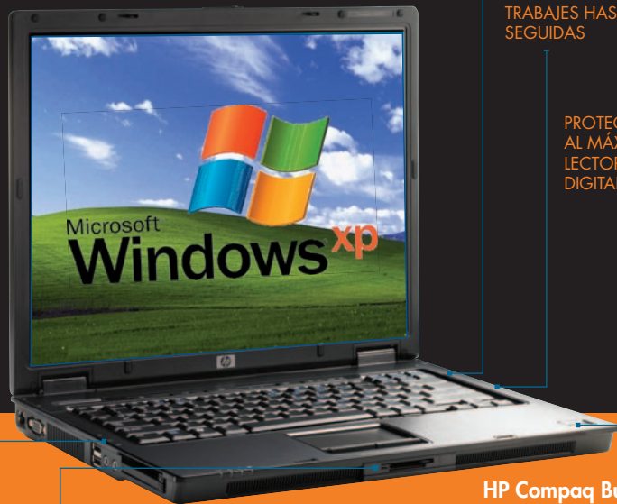
HP Compaq Business Notebook nx6320

PROTEGE TUS DATOS AL MÁXIMO CON EL LECTOR DE HUELLAS DIGITALES