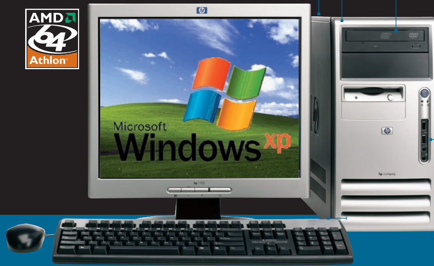
HP Compaq Business Desktop dx5150

UNIDADES ÓPTICAS Y DISCOS DUROS PARA TRABAJAR CON TUS DATOS Y APLICACIONES