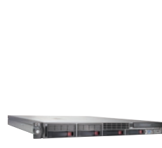
HP ProLiant DL360 G5

La opción para empresas con grupos de trabajo