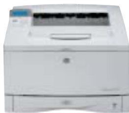
HP LaserJet 5100

Impresora de formato amplio versátil, para impresión de planos, equipos de publicidad, finanzas y trabajo de oficina en general.