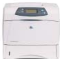
HP LaserJet 4250

Alto rendimiento, confiabilidad y versatilidad para grupos de trabajo.