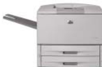
HP LaserJet 9050

Impresión de alto volumen de sistemas centrales, cliente/servidor y aplicaciones emergentes de Internet.